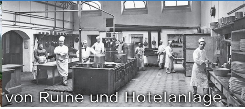
Restbestände von Ruine und Hotelanlage

Ein Teil des Küchentrakts des Grand Hotels konnte vor dem Abbruch gerettet werden. Der Steinküchenboden ist bis heute erhalten geblieben. Bis zu 200 Personen fanden in den Bädern Beschäftigung und die Bauernbetriebe konnten hier ihre Produkte absetzen. Flanierwege der früheren Hotelanlage (Springbrunnen, Tennisplatz, etc.) sind gut begehbar.